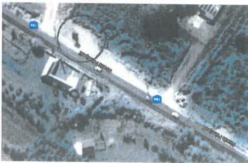
Plan de încadrare în zonă – parcare ” Troia din Rozavlea” – Amplasament 2

Conform documentației de urbanism faza PUG nr. 45/2011 terenul este în extravilanul UAT Rozavlea, în zona de protecție sanitară – stație de epurare, are o suprafață de 763 mp și este proprietate publică/ privată a UAT Rozavlea.