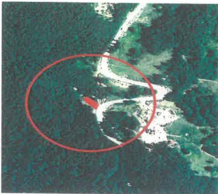
Plan de încadrare în zonă – parcare ” Pasul Neteda” – Amplasament 1