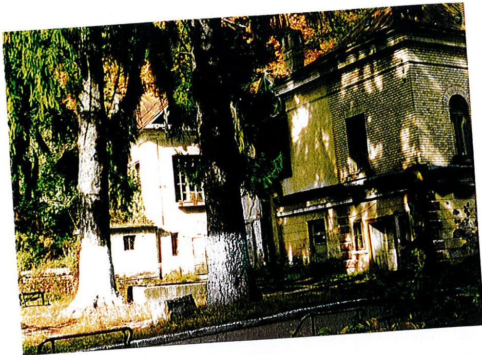
CLĂDIRE CASTEL FATADELE VEST SI SUD-PARTIAL