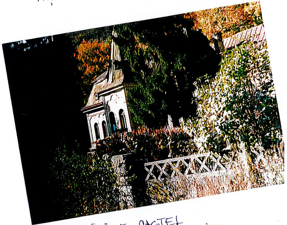
CLĂDIRE CASTEL FAȚADA SUD - PARTIAL.