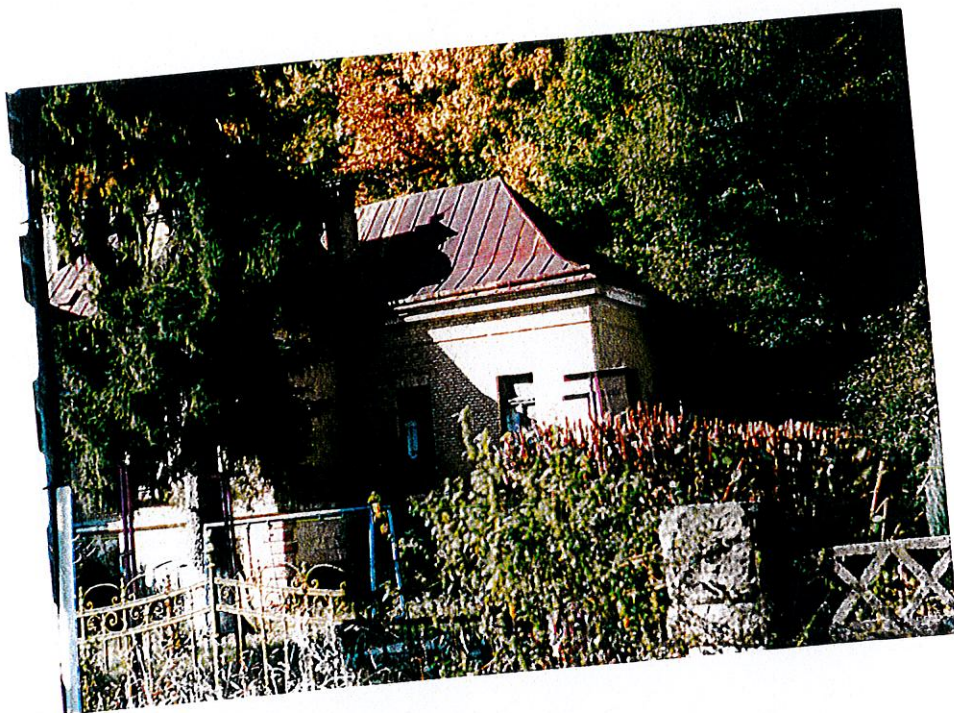
CLĂDIRE CASTEL FATADELE EST SI SUD-PARTIAL